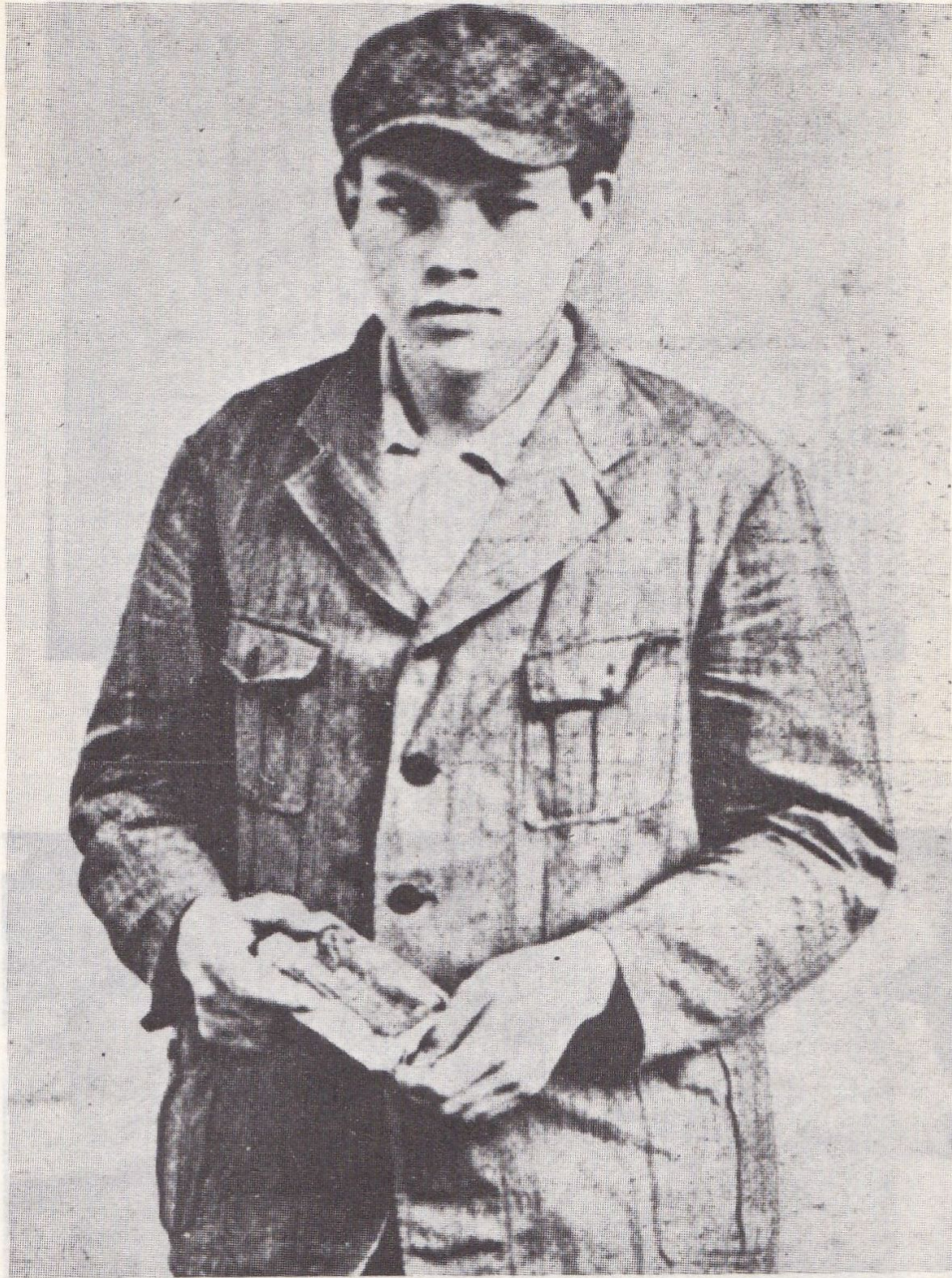
Marinus van der Lubbe