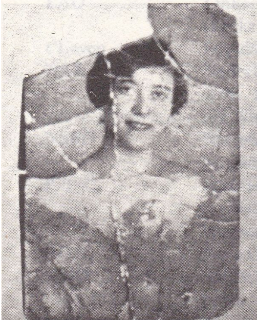
Die ungarische Freundin