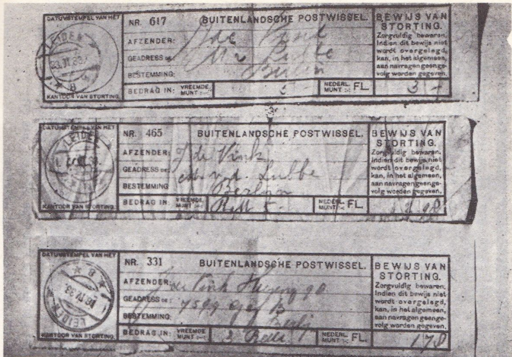
Drei Empfangsbestätigungen über v. d. Lubbe geschicktes Geld